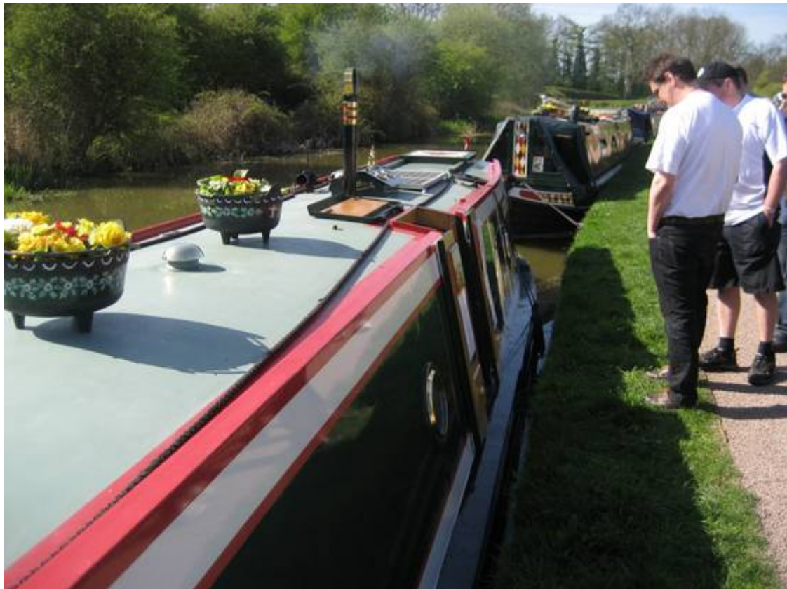
De klassiska kanalbåtarna kallas "narrowboats" och de är helt unika för Storbritannien.

Kanalbåtarna är inte svåra att köra, men eftersom de är både långa och tunga måste man köra med viss framförhållning, eftersom de reagerar långsamt. Det behövs inget "körkort" eller förarbevis för att föra fram kanalbåtarna, men det är säkert bra att "känna" på båten de första timmarna man kör. Båtarna är oerhört robusta, konstruerade med stålskrov, så det går knappast att skada dem. Kanalerna är dessutom inte djupare än cirka 1,5 meter och det är sällan längre än 10 meter till land, så olycksriskerna är minimala.