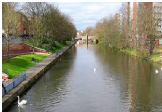
River Soar rinner genom Leicester

Enligt en legend så kastades Kung Richard III efter sin död i River Soar, och bron som bär väg A47 över floden är känd som "King Richards Bridge". Nu vet vi ju att den legenden är fel! Man tror också att namnet Leicester härstammar från orden castra och Legro, vilket skulle betyda invånare (castra eller camp) vid floden Legro (Legro eller Ligure är det gamla namnet på River Soar). Från 900-talet finns namnet Ligeracester (the town of the Ligor people) registrerat och senare i Domedagsboken är staden benämnd Ledecestre.