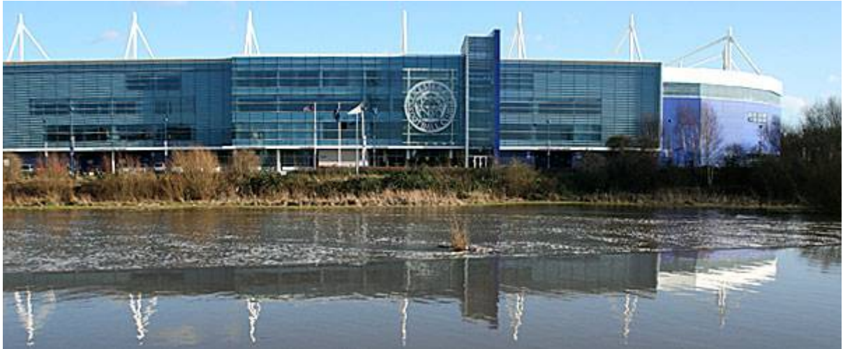
King Power Stadium, vackert beläget vid River Soar