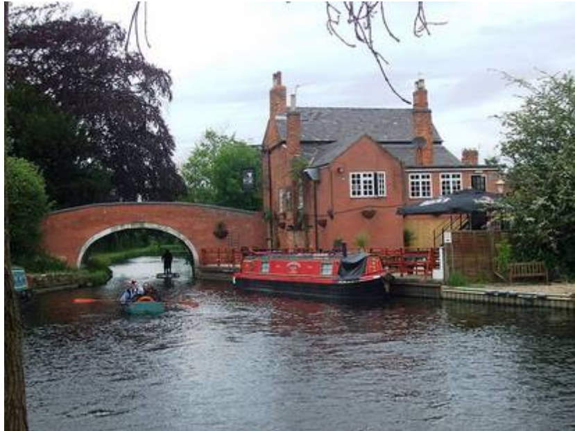
Barrow On Soar

River Soar som stiger upp nära Hinckley och förenas med River Sence nära Enderby innan den flyter genom Leicester är en biflod till River Trent och vacker vattenväg genom Leicestershire. I Leicestershire förenas River Soar även med Grand Union Canal (vilken har sitt ursprung nere i Brentford, London), det sker i Barrow On Soar. River Soar gjordes farbar för båtar genom Leicestershire redan 1784 och massor av genvägar byggdes. 1814 kopplades River Soar ihop med Grand Union Canal, via North Junction.