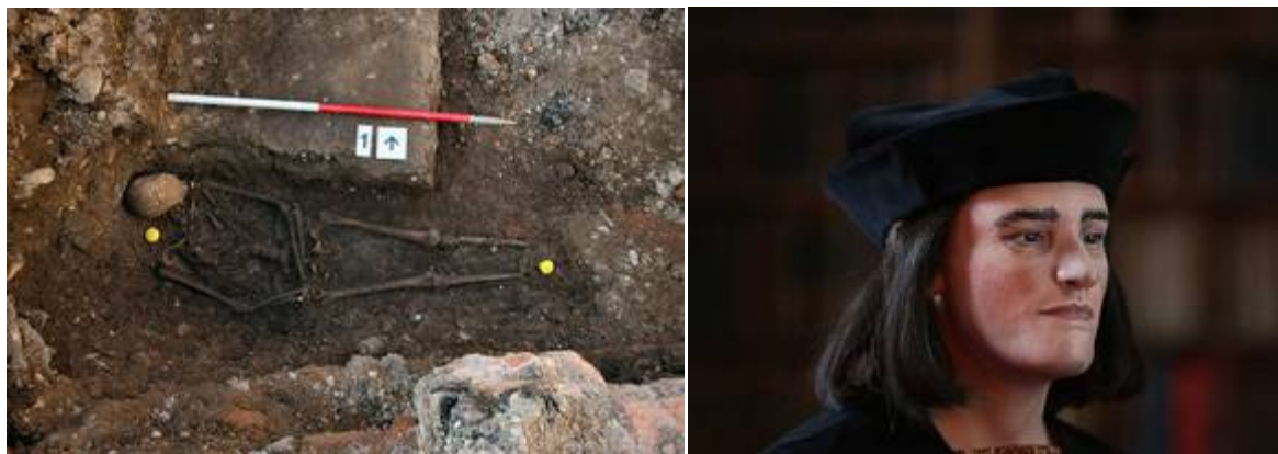
Till vänster skelettet och till höger en rekonstruktion av hur Kung Richard III såg ut.