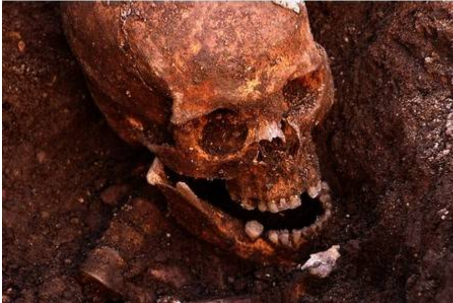
Kung Richard III:s kranium

Richard var, i alla fall utåt sett, en vänlig människa och en god administratör. Dock hade han hänsynslöst utrotat Woodvilles och deras anhängare, dessutom så var han änkeman och saknade arvinge, så han var sårbar för politiska motståndare. Hans mest lojale, Henrik Stafford, hertig av Buckingham, vände sig mot honom, och avrättades.